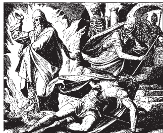
Die Wahrseherin von Endor (1. Sam. 28)